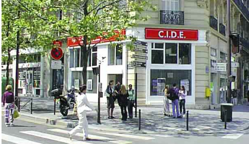
Paris, quartier latin, l'expérience d'une équipe au service des jeunes et des parents.

Centre d'Information et de Documentation sur l'Enseignement privé